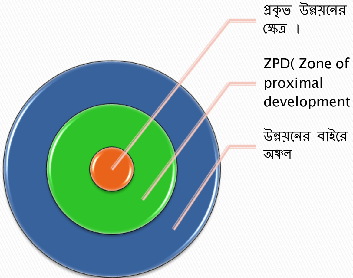
Image of ZPD